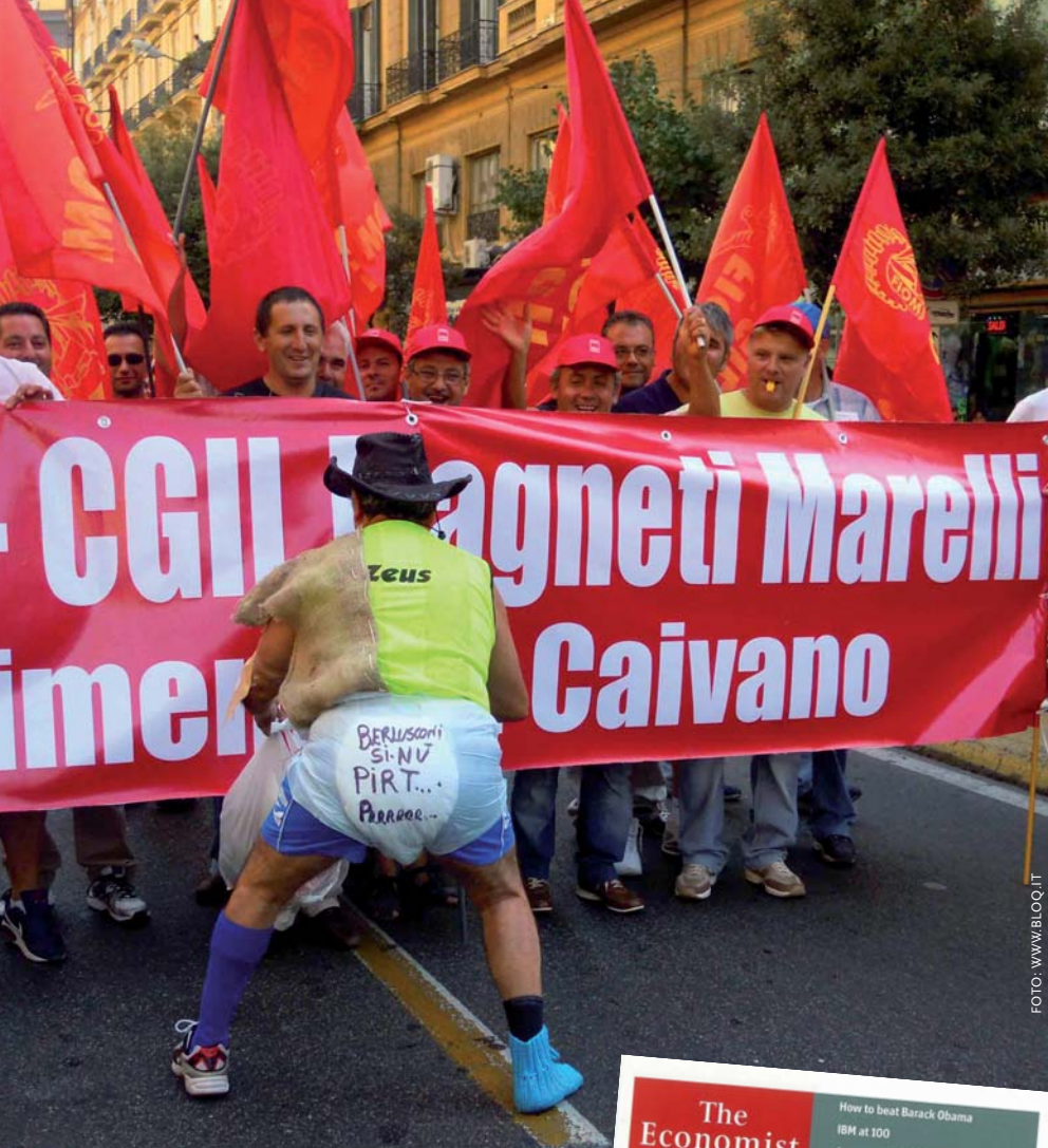
Noord tegen Zuid en iedereen tegen de bezuinigingen van Berlusconi en Tremonti. In Napels steekt een betoger in luier de draak met Berlusconi's 'schijtland' tijdens de door de vakbond CGIL uitgeroepen algemene staking op 6 september 2011.