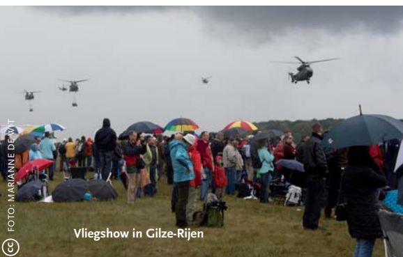
Vliegshow in Gilze-Rijen

Van een bewuste ruimtelijke strategie is in de Nederlandse context dus geen sprake. Ja, de krijgsmacht is ervan doordrongen dat zij zich in Nederland voortdurend moet verantwoorden voor haar bestaan en dat wanneer er even geen inzet is, al snel de roep klinkt om opheffing. Daarom doet ze inderdaad veel aan pr en wordt veel energie gestoken in campagnes om militairen te werven. Na afschaffing (opschorting) van de dienstplicht moest de krijgsmacht haar rekruten