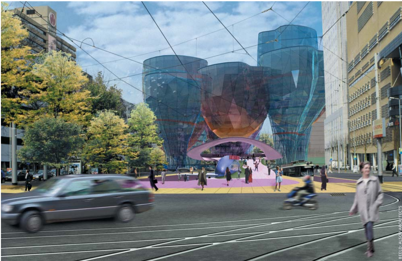
Het dure en extravagante ontwerp met 'champagne-glazen' van William Alsop viel verkeerd bij de Rotterdammers, die 'helemaal niet van champagne houden'.

waarvan het Rijk er 6 heeft aangewezen als sleutelproject. Dit zijn stationsgebieden die worden beschouwd als episch centrum van stedelijk leven en een motor voor de stedelijke economie.